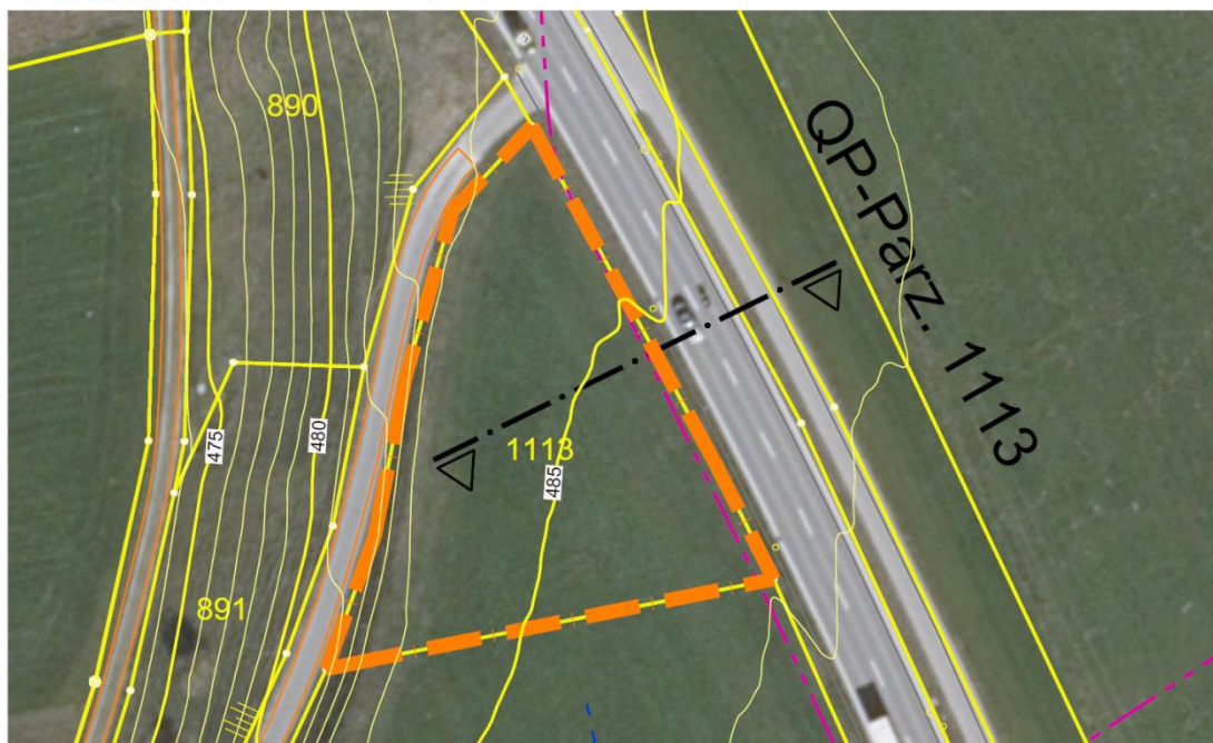
Abbildung 2: Situation Parzelle Nr. 1113 mit Höhenlinien