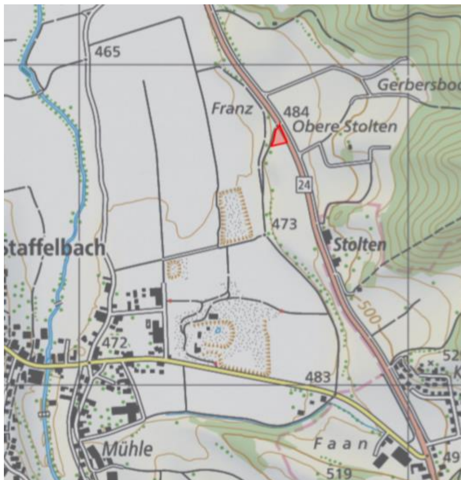
Abbildung 1: Lage der beantragten Arrondierung der MAZ «Stoltenrain» (rot)

Die Arrondierung der Materialabbauzone umfasst ca. 1'500 m 2 (0.15 ha). Die Arrondierung liegt westlich der Kantonsstrasse K108 und tangiert Fruchtfolgefleichen.