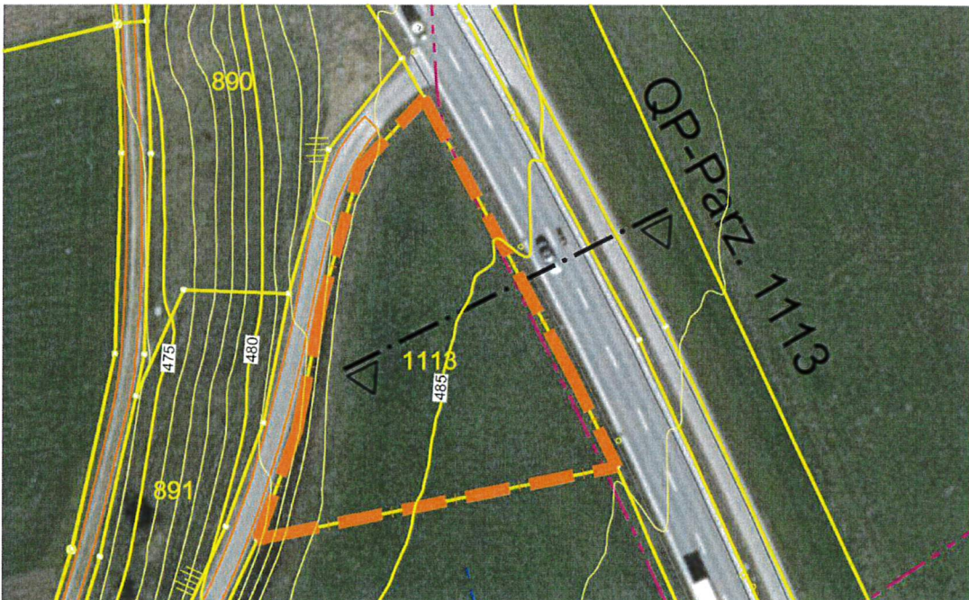
Abbildung 2: Situation Parzelle Nr. 1113 mit Höhenlinien